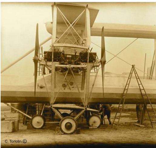
Triplan 1916 : moteurs Hispano, poutres section circulaire etc