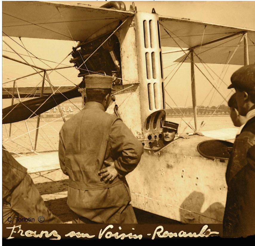
Il faut être souple pour se glisser dans le cockpit

Jusqu'à présent on connaissait cet original appareil muni du moteur Salmson/Canton-Unné. En voici un exemplaire équipé d'un moteur Renault Type 12F de 200 ou 220 ch (à la place du 150ch Canton) placé de façon un peu vertigineuse au sommet de sa tour (septembre 1915).